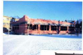
nová školovně budova

Líbí se mi, že se začala stavět nová škola. Doufám, že se na její půdě rodí děti předstihujícího. Najdu a žijú na své nové školovně.