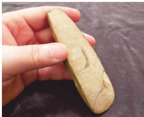
Kamenná sekerka ze Srbiná

Výjimečné jsou proto nálezy dvou kamenných nástrojů ze severního okraje Srbiná. Broušenou sekeru (na obrázku) i sekeromlat s vyvrtaným otvorem pro topůrko vyrobili nositelé kultury s vypíchanou keramikou z mladší doby kamenné (5. tisíciletí př. n. l.). S velkou pravděpodobností zde však nebylo v tomto období větší sídliště a kamenné sekerky můžeme považovat za ztracené či zapomenuté.