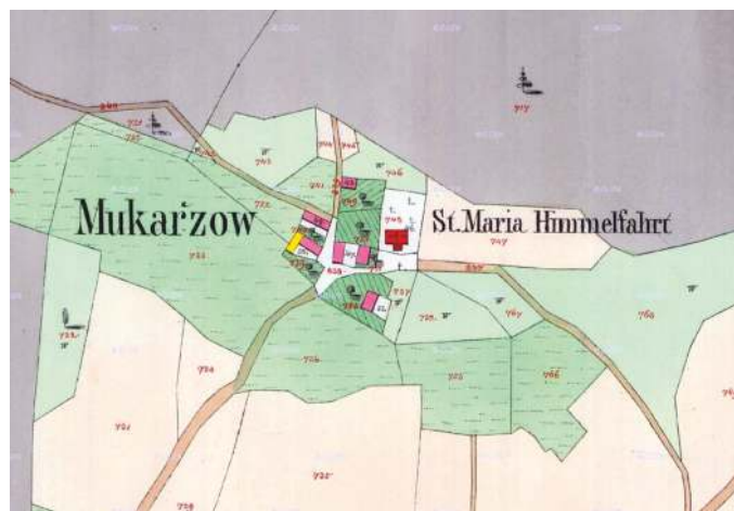
Mapa stabilního katastru (1841) s vyznačením polohy původního kostela

středověkého Mukařova můžeme situovat na mírné návrší na pravém břehu říčky Výmoly. Hlavní osu tohoto osídlení, které můžeme datovat na přelom 12. a 13. století, tvoří dnešní Tyršova ulice. Patrně ve stejné době mohl být postaven i kostel, ke kterému přiléhá hřbitov. Další menší usedlosti se nacházely jihozápadním směrem od centra obce a po obou stranách lemovaly údolí Výmoly.