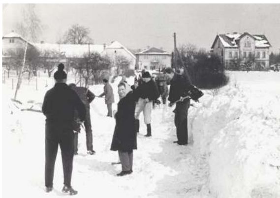
Sněhová kalamita v roce 1970

Ohledně cen se nakonec zastupitelstvo rozhodlo celé navýšení nepromítat do cen svozu v roce 2018 a částečně je pokrýt z rozpočtu obce. Toto řešení je ale dlouhodobě neudržitelné, už proto, že – jak jsem už zmínil – náklady na ukládání a