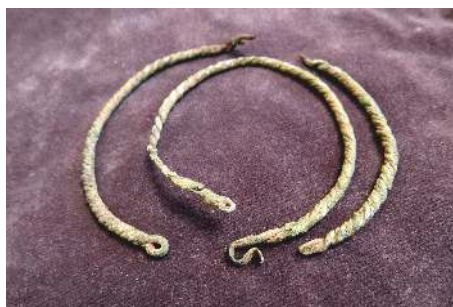
Esovité záušnice nalezené v roce 1890 při stavbě kostela

Přestože archeologických nálezů z katastru obce není mnoho, poskytují nám poměrně komplexní obrázek o rozsahu a vývoji Mukařova od jeho počátků až do doby třicetileté války, kdy Mukařov téměř zanikl. Jádro