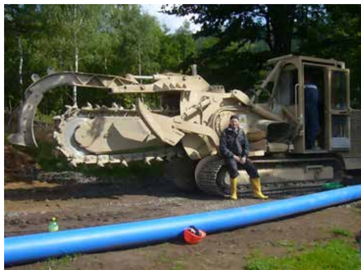
Přes nasazení veškeré techniky se termín dokončení vodovodu nepodařilo dodržet.