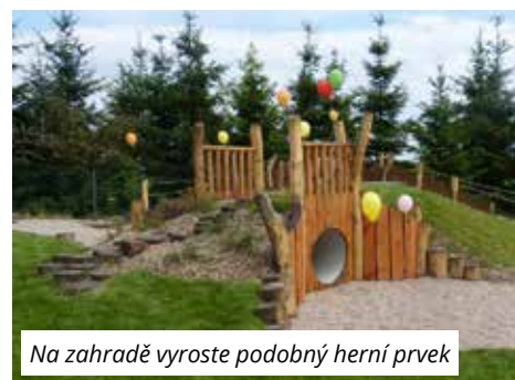
Na zahradě vyroste podobný herní prvek

Věra Doležalová, zástupkyně ředitelky MŠ Mukařov