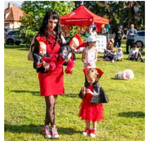
Nejmladší účastníci psiho karnevalu. Pejsek měl samozřejmě také upíří kostým.