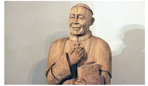
Dřevěná socha arcibiskupa Berana v mukařovském kostele