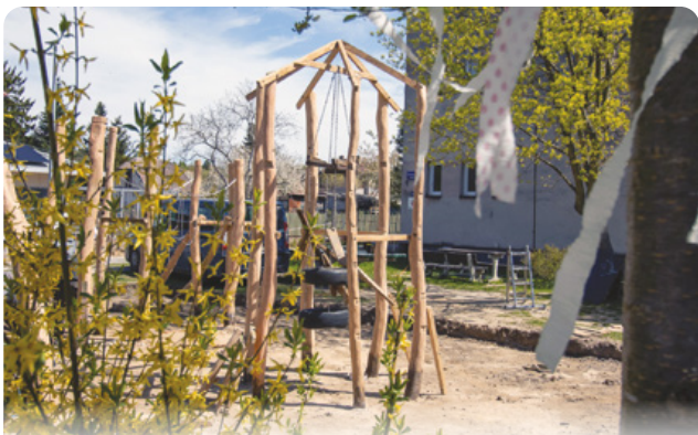
Osmnáct let staré dětské hřiště v Mukařově prochází generální opravou. Hotovo bude v průběhu května.